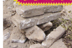
コンクリートガラ